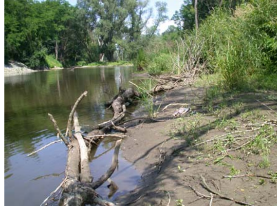
Der Kamp bei Hadersdorf

Gemessen werden Wasserspiegellagen, Wassertiefen und Fliessgeschwindigkeiten, spezielle Versuche mit Farbzugabe zur Strömungsvisualisierung und Totholzzugabe sind ebenfalls geplant. Die Dokumentation der Gerinnegeometrie eines Wasserbaulichen Modellversuches erfolgte erstmals in Österreich mittels terrestrischem Laserscanning in Zusammenarbeit mit Firma Riegl aus Horn ( www.riegl.com ).