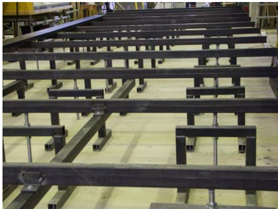
Neigbare Unterkonstruktion im Bauzustand

Eine in der Natur fast 400 m lange Strecke wurde generalisiert im Maßstab 1:25 im Wasserbaulichen Labor der Universität für Bodenkultur Wien nachgebildet. Der Unterbau wurde so ausgeführt, dass das gesamte Modell neigbar ist. Der temporäre Umbau der Messanlage zur Fräsanlage ermöglichte die Verwendung eines für diese Zwecke völlig neuen Baustoffes. extrudiertes Polystyrol (XPS) stellte sich zur Modellierung der Gerinnegeometrie als hervorragend geeignet heraus.