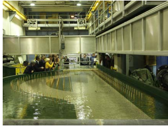
Besichtigung des wasserbaulichen Modellversuchs Kamp

Eine in der Natur fast 400 m lange Strecke wurde generalisiert im Maßstab 1:25 im Wasserbaulichen Labor der Universität für Bodenkultur Wien nachgebildet. Der Unterbau wurde so ausgeführt, dass das gesamte Modell neigbar ist. Der temporäre Umbau der Messanlage zur Fräsanlage ermöglichte die Verwendung eines für diese Zwecke völlig neuen Baustoffes. extrudiertes Polystyrol (XPS) stellte sich zur Modellierung der Gerinnegeometrie als hervorragend geeignet heraus.