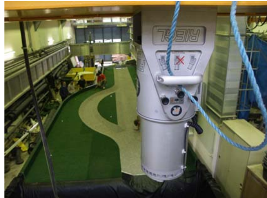
Terrestrischer Laserscanner LMS Z420i der Firma Riegl beim Scannen des Modells

Die physikalische Simulation im Wasserbaulabor wird mit der numerischen Simulation am Computer gekoppelt. Der Vergleich mit Naturmessungen trägt zum Verständnis der Wechselwirkungen zwischen Abfluss, Vegetation und Totholz bei.