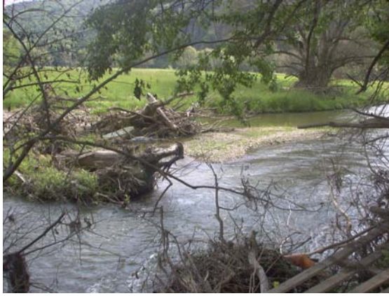
Der Kamp bei Altenhof