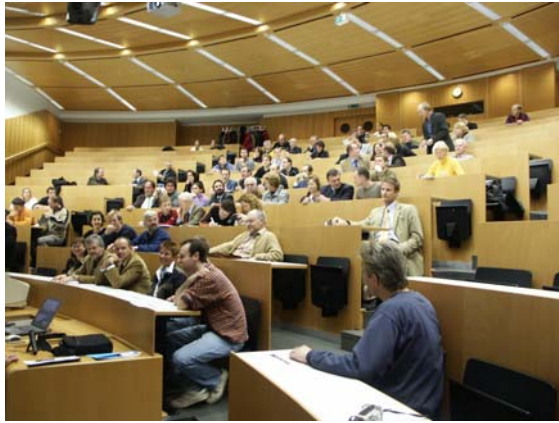
Einführung zum Thema „Hochwasser und Vegetation“

Der Bau des wasserbaulichen Modells wurde vor kurzem abgeschlossen und die Versuche zum Thema „Auswirkung der Vegetation auf das Abflussverhalten“ laufen auf Hochtouren. Die Präsentation des wasserbaulichen Modellversuchs am 8. November 2004 stieß auf sehr großes Interesse. In einem kurzen Einführungsvortrag wurden die Problematik und die Hintergründe erläutert und anschließend im Labor und bei einer kleinen Jause ausführlich diskutiert.